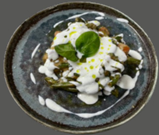
Картопляні крокети з сирним соусом