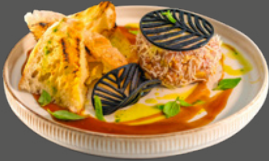
Тар-тар із телятини філе-мінйон з трюфелем та пармезаном (вирізка теляча, гірчиця французька, соус табаско, артишоки, сир Пармезан, вафельний роялтин, брускети чіабати гриль) 165 г / 185 грн