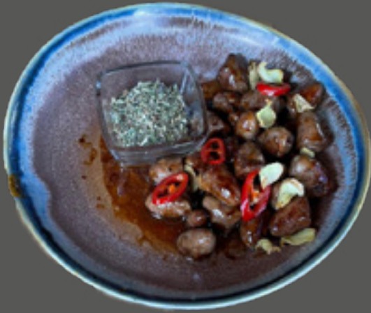
Сердечка курячі в соусі теріякі (сердечка курячі, соус теріякі з імбиром і чілі, спеції)