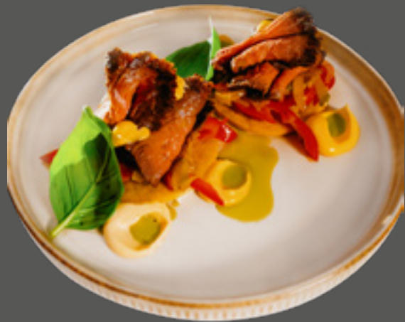
Телячі роли з печеним перцем та соусом-маринадом татаки (вирізка теляча, фірмовий соус татаки, перець печений маринований, сир вершковий) 170 г / 165 грн