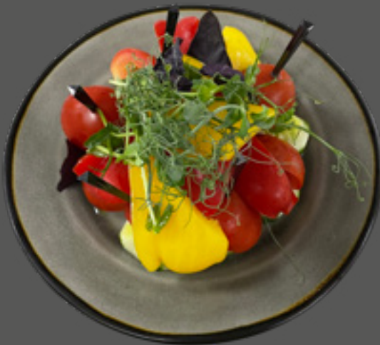
Асорті овочеве (огірок, помідор, перець болгарський, цибуля) 205 г / 90 грн