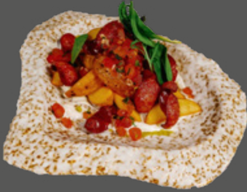
Картопляні діпи з мисливськими ковбасками (картопля, мисливські ковбаски, сальса овочева, соус сирний)