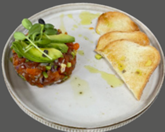
Тартар з лосося (лосось слабосолений, артишоки, авокадо, цибуля червона, олія оливкова, брускети чіабати, каперси) 215 г / 215 грн